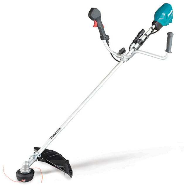
360° Imagem 360°