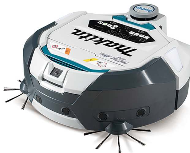
360° Imagem 360°